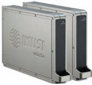
FLOW IN (Ref. 4306) y FLOW IN4 (Ref. 4319)