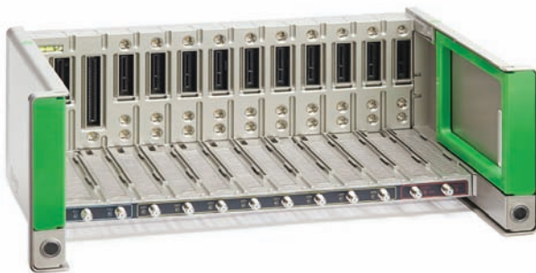
FLOW BASE (Ref. 4312)