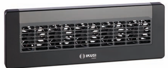
FLOW COVER (Ref. 4316)