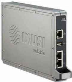
FLOW HUB (Ref. 4314)