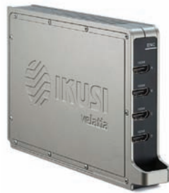
FLOW ENC (Ref. 4315)